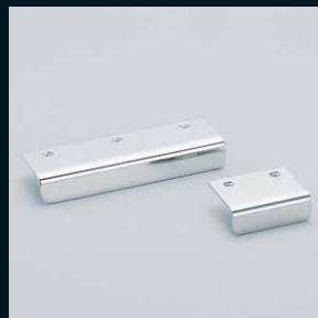
アングルハンドル SN型 (P.64)