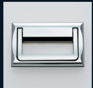
トランクハンドル HCT-150 (P.96)