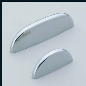
取手 RD型 (P.50)