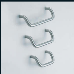
ハンドル LF-12型 (P.24)