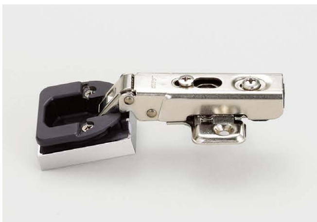
写真はG230-32/19T、またはG230-C32/19T (キャッチ付) とマウンティングプレート230-P4W-30Tとの組み合わせです。