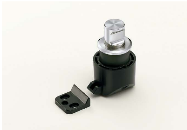
■つまみ プッシュ時