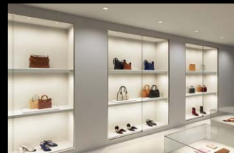
ヴィトリスロブスタス (No.200カタログ、3/3巻、P.340)