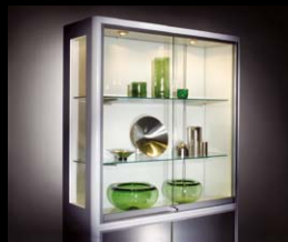
ヴィトリススーパ (No.200カタログ、3/3巻、P.336)

WILLACH ヴィトリスガラス引戸金物と同じ仕上げの棚柱・棚受です。組み合わせて使用すると統一感のあるガラスショーケースを構築できます。