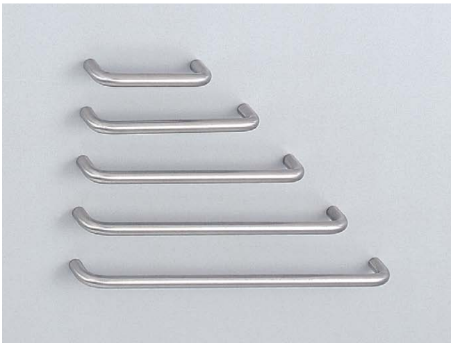
写真はヘアライン仕上げです。