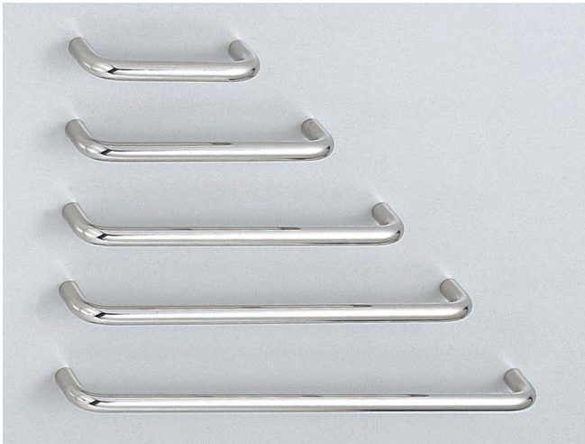
写真は鏡面研磨仕上げです。