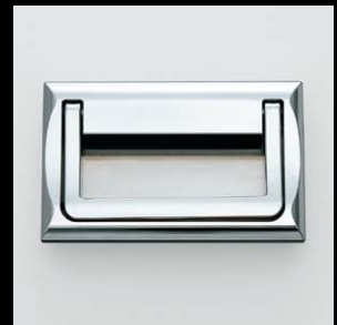
トランクハンドル HCT-150 (P.96)