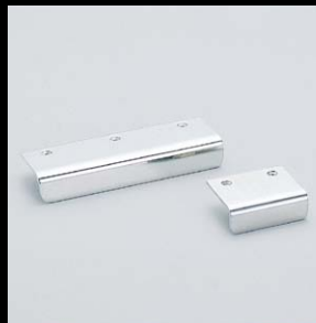
アングルハンドル SN型 (P.64)