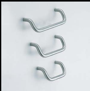
ハンドル LF-12型 (P.24)

スガツネのステンレスシリーズは、ハンドルからフック、スライドレール、丁番など、あらゆるアイテムを取りそろえています。素材および主材料にステンレス鋼を使用しているため耐食性に優れ、長年にわたりその美しさを保ちます。また、飽きのこないシンプルなデザインは場所を選ばず広範囲に使用できます。