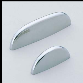
取手 RD型 (P.50)